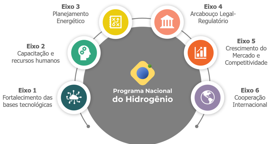
Figura 3 - Eixos temáticos que compõem o PNH 2

Os trabalhos em todos os eixos deverão prever ações com o objetivo de promover a comunicação com a sociedade e agentes interessados, inclusive no sentido de esclarecer os riscos e benefícios relacionados ao hidrogênio.